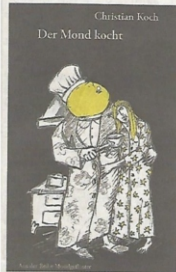
Das Cover des zweiten Buches.